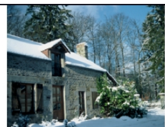
Gîte Panda, ancien corps de ferme

En voiture par la N12 (Paris : 200 km, Rennes 130 km).